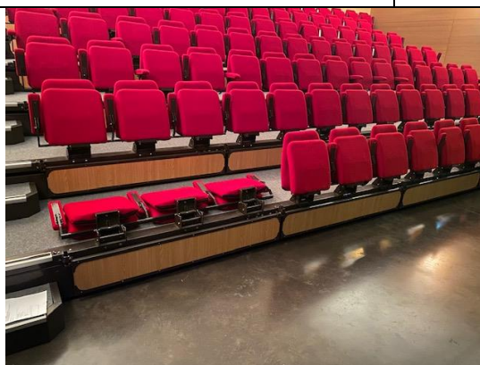
Places PMR Auditorium