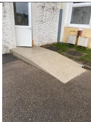
Modification de la rampe existante