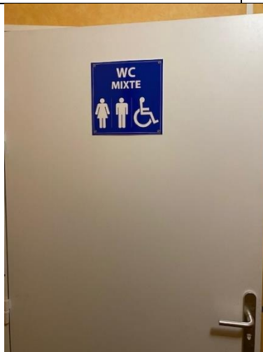
Signalétique sanitaire PMR