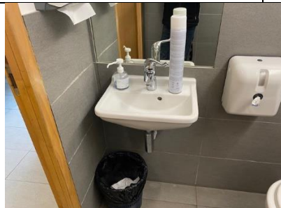
Lavabos accessibles PMR