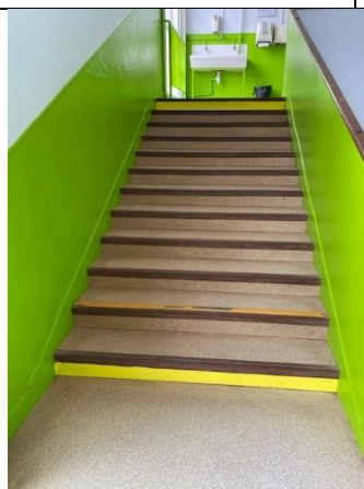
Rappel tactile et contrasté sur les escaliers