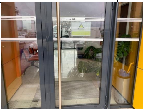
Signalisation sur vitrage porte d'entrée

Le choix de la municipalité s'est porté sur l'accessibilité de tous les Etablissements Recevant du Public (ERP). Le programme est établi sur une période de 5 ans (2019-> 2024) pour un montant global de 123 280 €.