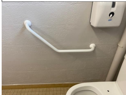
Gymnase : Barre de tirage sanitaire PMR