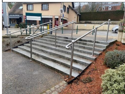
Main courante sur escalier extérieur